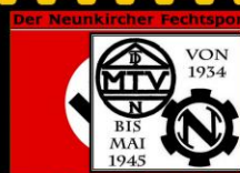
Im Deutschen Reich