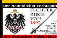
Im Deutschen Kaiserreich

Die Zeit davor von 1892 bis 1955 Teile 1 bis 3