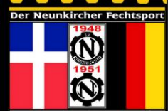
nach dem zweiten Weltkrieg

Im einst größten Dorf Preußens Neunkirchen - damals schon von Kohle und Eisen geprägt - stand 1892