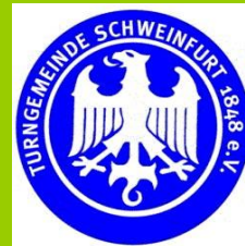
Fechtabteilung der TG 1848 Schweinfurt